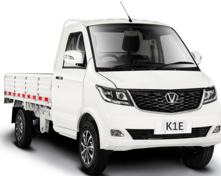
EV Mini Truck 2 sedadla