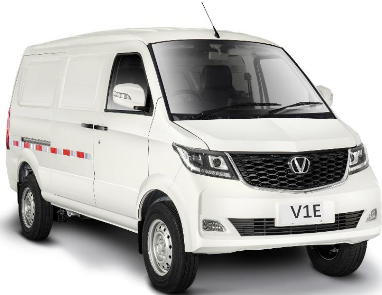
EV Mini Van 2 sedadla